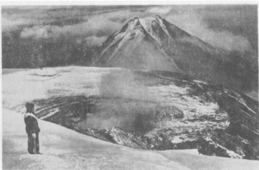
Обрушение кальдеры и уничтожение части Толбачинского ледника вулкана Плоский Толбачик. Август 1966 г.

Наиболее молодые вулканы, склоны которых еще не подверглись влиянию эрозионных процессов (Ключевской, молодой конус Авачинского), имеют ледники типа вулканических поясов. Кратерные ледники находятся в кратерах как действующих, так и потухших (Мутновские ледники) вулканов. На отдельных вулканах развиты ледники барранкосов*, расположенные в долинах, выпадающих к вершине (вулканы Жупановский, Корякский и др.). Сложные вулканы, формировавшиеся в течение длительного времени, имеют сложные ледники (кальдерно-долинные, атрио-долинные и др.), являющиеся крупнейшими ледниковыми образованиями. Так, ледник Бильченков после подвижки 1959 г. имел длину более 18 км. Атрио-долинные ледники — область питания находят-