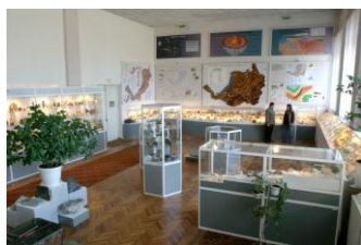
Экскурсия по залам музея Бурятского научного центра СО РАН