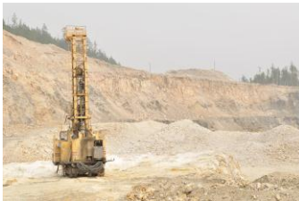
Полевая экскурсия на Черемшанское месторождение кварцитов