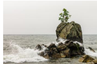
Полевая экскурсия по берегу оз. Байкал

По окончании работы конференции с 27 по 29 августа участникам (при наборе не менее 10-15 человек) предоставляется возможность принять участие в полевой экскурсии на Озёрное колчеданно-полиметаллическое месторождение . Регистрационный взнос составляет 5500 руб. (проезд, проживание в п. Сосново-Озерское, 2-х разовое горячее питание, сухой паек в течение 3-х дней). Регистрация откроется 15 марта. Ссылка будет доступна во втором циркуляре.