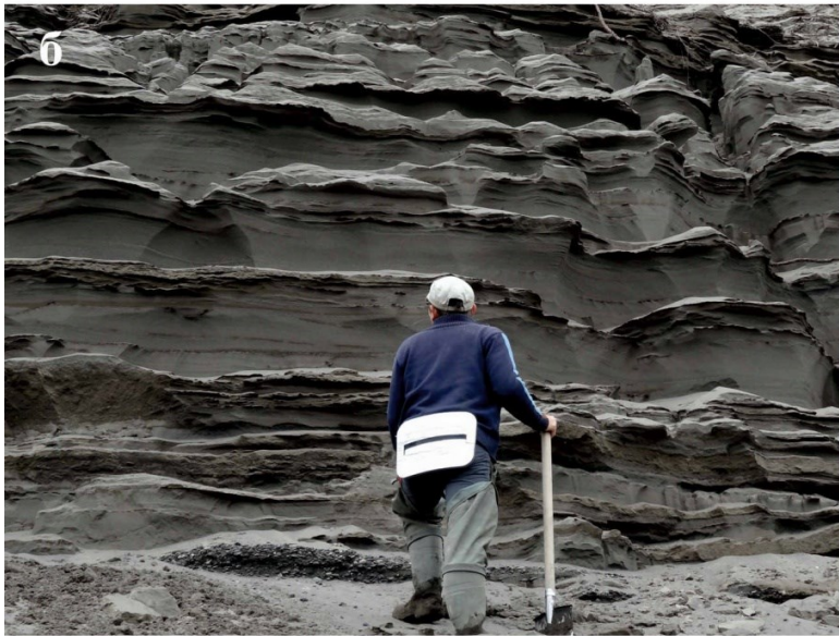
Рисунок. Распространение толщи Шапинских песков Центральной Камчатки, цифрами показаны номера разрезов, см. в тексте (а). Толща Шапинских песков яра Рыбачок (б). Схематическое строение разреза яра Николка (в). Радиоуглеродные даты из разрезов р. Караковой и Козыревки, пояснения см. в тексте (г).

1 – голоценовый почвенно-пирокластический чехол; 2 – пойменно-старичный аллювий; 3 – суходол (разнотравно-злаковый луг с березовым лесом); 4 – пойменный аллювий; 5 – песчано-галечная толща: а – песок, б – галька; 6 – прослой торфов, оторфованных песков; 7 – мелкие веточки ольхи; 8 – позвонок бизона; 9 – следы жизнедеятельности древнего человека на стоянке Ушки по [7]: а – разовое посещение стоянки, б – регулярное присутствие.