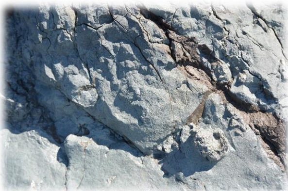
Прослой майкопских шоколадных глин