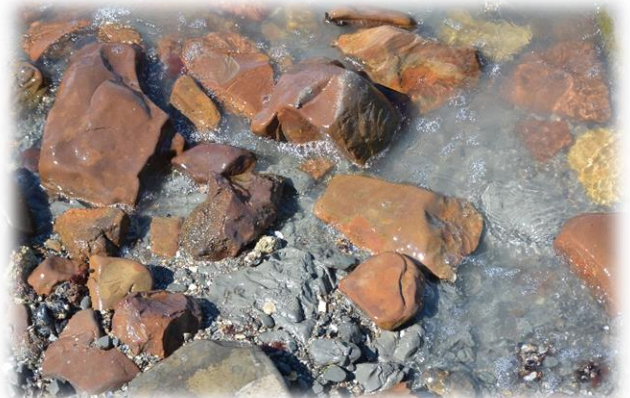
Майкопские глины на морском дне