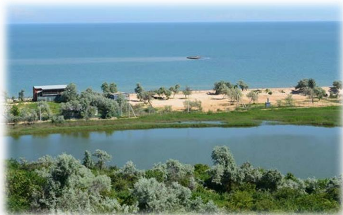
Голубицкий грязевой вулкан