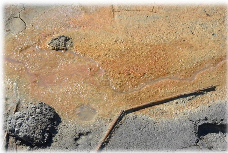
Грязевой поток вулкана Азовское Пекло