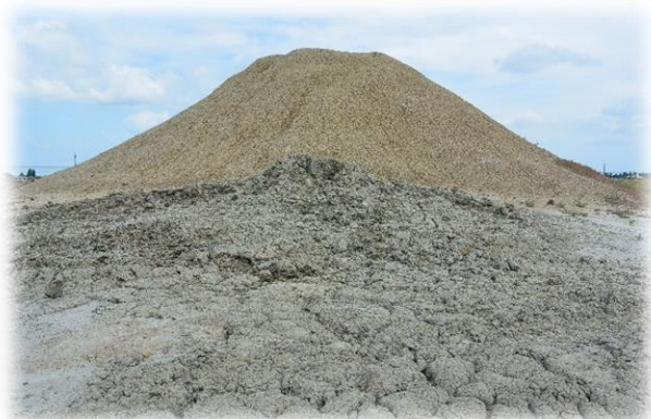
Кратер грязевого вулкана

Вы познакомитесь с грязевыми вулканами Таманского полуострова – прямыми аналогами проявлений нефти и газа в глубоководных зонах Черного моря, изучите их типы и структуру, состав углеводородов и продуктов их извержений, а также литологические характеристики грязевых брекчий.