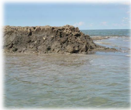
Кратер грязевого вулкана на берегу Азовского моря