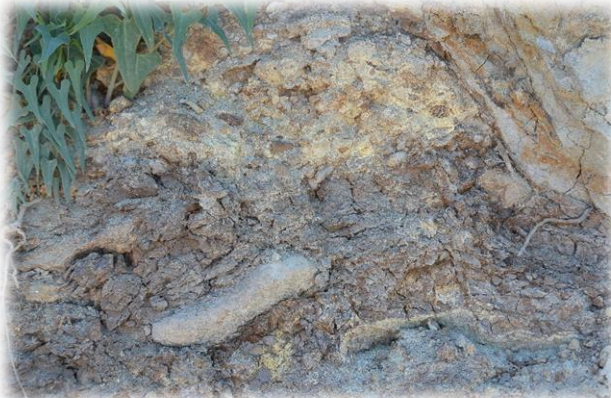
Выход майкопских глин в береговом обрыве