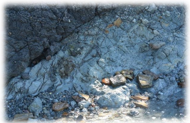
Выход майкопских глин в береговом обрыве