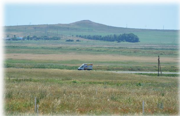
Грязевой вулкан Ахтанизовский (юго-западная окраина станицы Ахтанизовская)