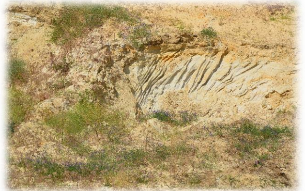
Слоистость в сарматских песчаниках (дельтовые отложения)