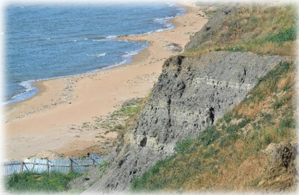
Береговые обнажения майкопской свиты

Вы узнаете о строении мезозойско-кайнозойских нефтегазоносных осадочных комплексов Черного моря на примере разрезов Таманского полуострова. Вместе мы рассмотрим связь нефтегазоносных систем с тектоническими характеристиками региона (Индоло-Кубанского прогиба) и ознакомимся с источниками, коллекторами и ловушками отложений триасо-неогенового возраста – прямыми аналогами современных глубоководных толщ Черного моря.