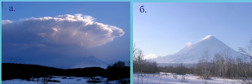
Рис. 3. Извержение вулкана Безымянный 9 мая 2006 г. (а), фото Ю.В. Демянчука. Аэрозольный шлейф над вулканом Безымянный (крайний слева) 2 декабря 2006 г. (б), фото В.Г. Ушакова.