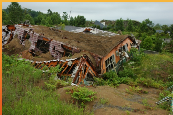
Рис.4. Кондитерская фабрика, разрушенная при извержении вулкана Усю в 2000 году.