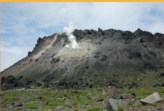
Рис.6. Экструзия вулкана Тарумай с активной fumarолой на склоне.