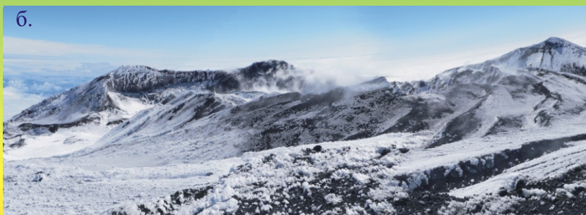
Рис. 9. Состояние вершинного кратера вулкана Ключевской: 21 августа 2005 г. (а); 22 июля 2006 г. (б).