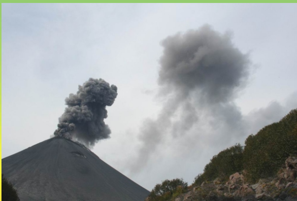
Рис. 8. Пепловый выброс из кратера вулкана Карымский и отдельное пепловое облако его предыдущей эксплозии 17 сентября 2006 г.