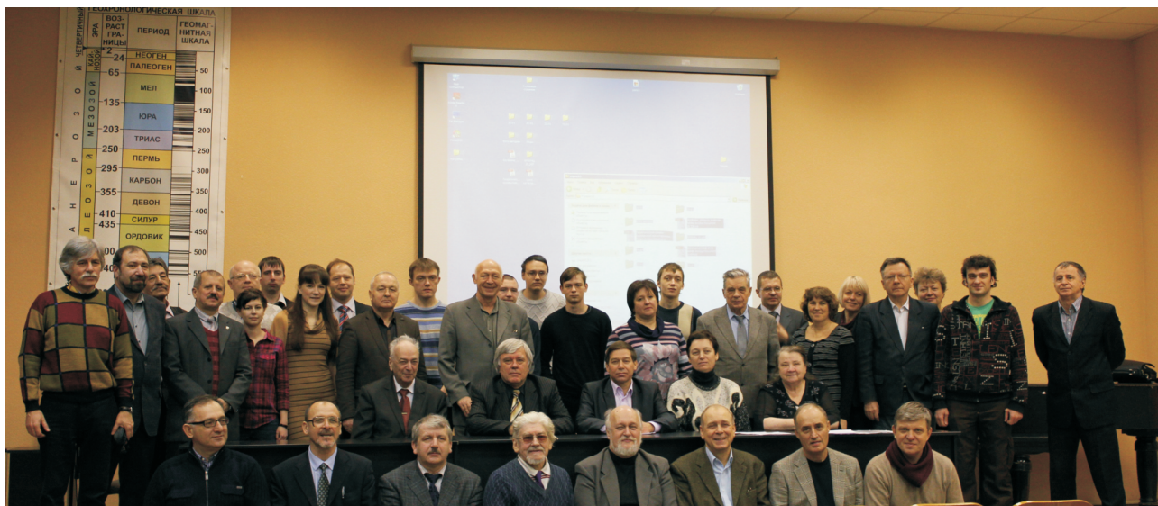
Рис. 2. Участники 40-ой сессии Международного семинара им. Д.Г. Успенского «Вопросы теории и практики геологической интерпретации гравитационных, магнитных и электрических полей».

2. Современные алгоритмы и компьютерные технологии интерпретации геофизических полей.