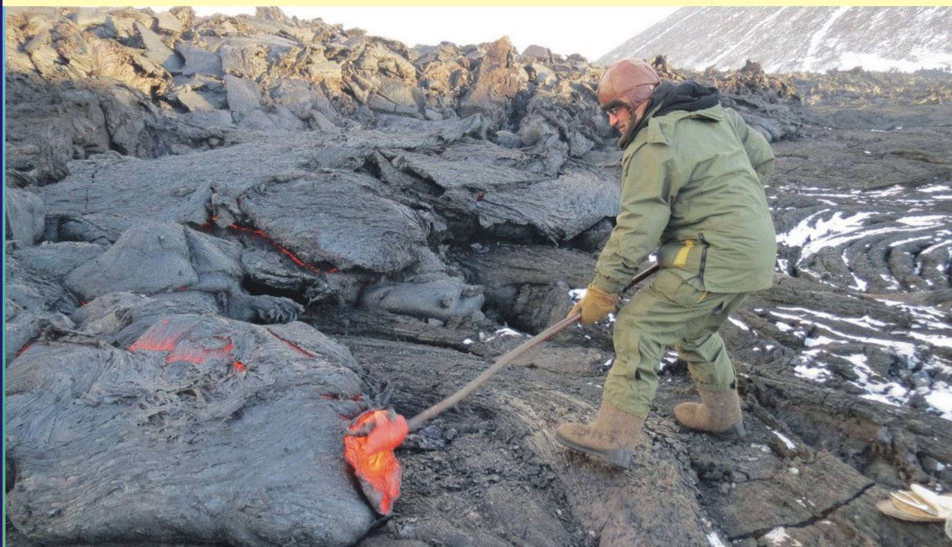
Рис. 6. Отбор проб свежей лавы.