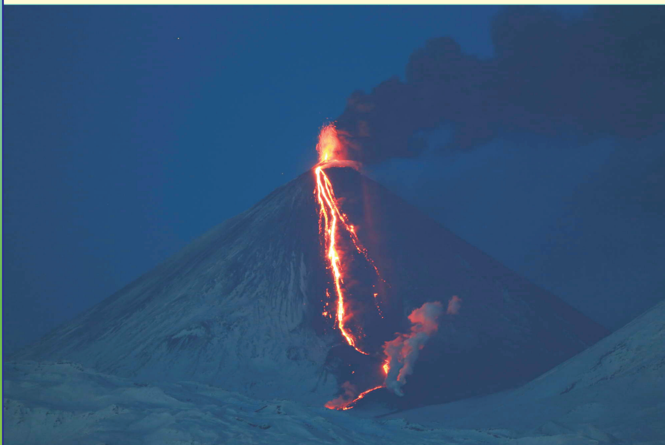
Рис. 8. Лавовый поток на юго-западном склоне вулкана Ключевской 12 октября 2013 г.